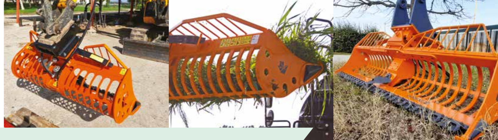
Immagini puramente indicative del modello vecchio