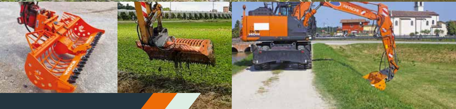
Immagini puramente indicative del modello vecchio